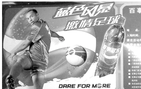
百事可乐公司的宣传广告